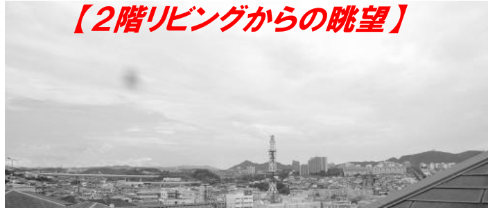
【2階リビングからの眺望】